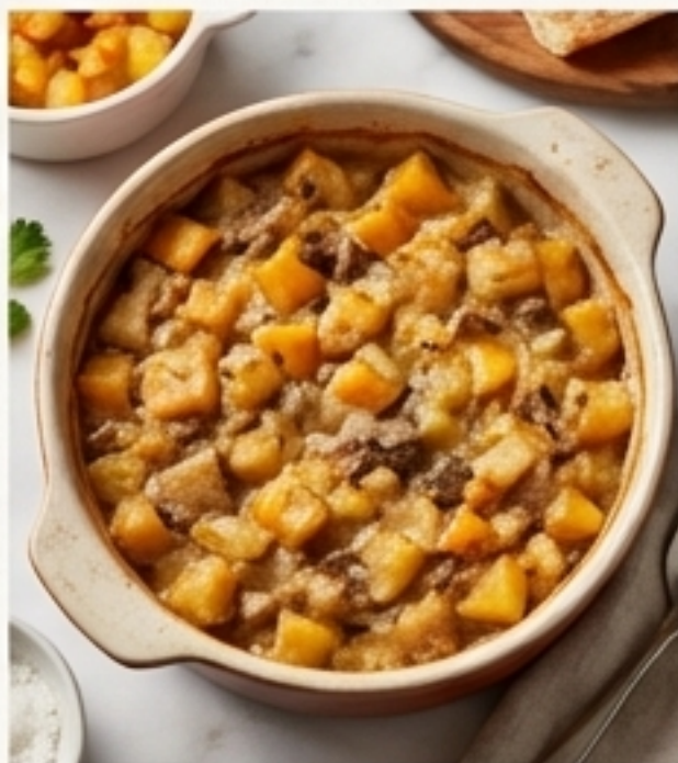
Guisos finlandeses (hígado, colinabo)