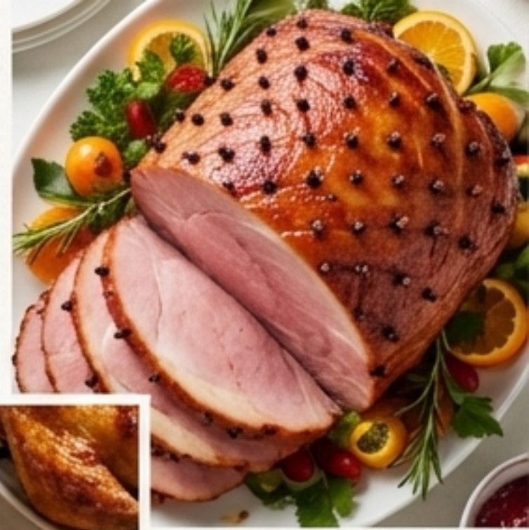
Jamón, pavo o cabra