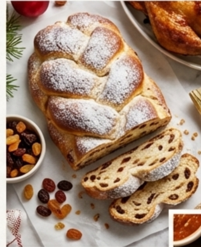
*Stollen y ganso alemanes